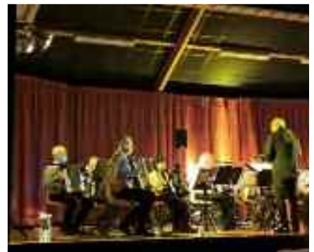
Concert de Nuances et Variations , orchestre d'accordéons, le 02 avril 2022