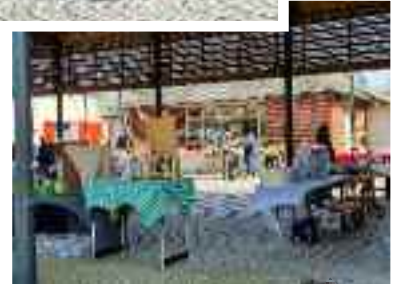
Marché du Printemps, le 26 mars 2022