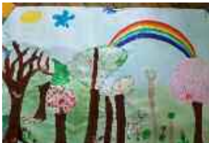
Grande fresque forestière réalisée par les enfants du Service Périscolaire, projet de mise en oeuvre : "La Nature"