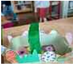
Atelier de décoration de Pâques de la bilbiothèque municipale, le 02 avril 2022