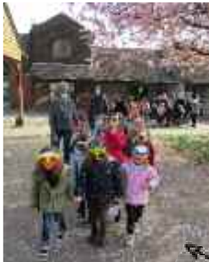
Défilé des maternelles, le 21 mars 2022