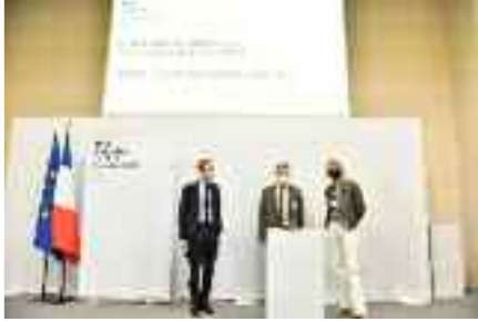
Remise du label 4 pour l'Ecoquartier des Arondes, le 21 janvier 2022

Cours d'informatique du CFA, un samedi par mois