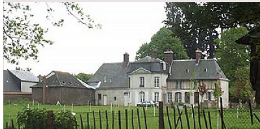
mairie de Roncherolles